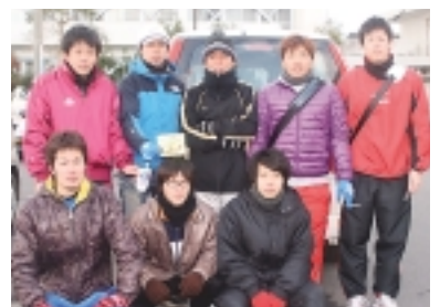
出場したJAごとう経済部