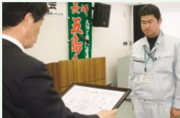
金賞を受賞した(有)富永畜肉