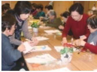
季節の花を描いた切り絵