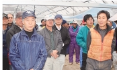
今年の豊作を願う栽培農家

播種祭には八十九 戸の栽培農家を含め た約一〇〇名が出席 し、二〇一一年産葉 たばこの豊作を願 いました。