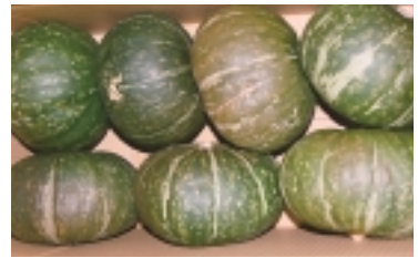
箱詰めされた抑制力ポチャ

本山カポチャ専用貯蔵庫では、一月下旬から抑制力ポチャの出荷が続いています。 抑制力ポチャは主に十二月の冬至頃までに出荷を行いますが、J Aでは貯蔵庫で貯蔵し、国内産かぼちゃの端境期となる一月下旬から三月中旬に出荷を行っています。