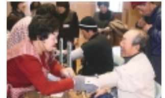
血圧測定で体調チェック

女性部はまゆう部会三井楽支部は二月八日、三井楽町公民館でミニデイサービスを行いました。同部は「たすけあい組織」として、年に三〜四回ほどミニデイサービスを行っており、今回は今年度最後の実施となりました。今回は血圧測定や介護士が行われ、自分自身の健康や認知症に対する理解を深めていました。また、季節の花を描いた切り絵では、一人一人の色や配置が異なるため、個性溢れる作品が完成しました。中でも参加者によるカラオケや大道芸、フラダンスは拍手が