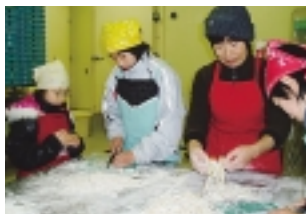
うどんの形になってきた!

実際にうどん作りを体験した子供たちからは生地を踏みながら「ぶにゅぶにゅしておもしろい」「楽しい」とも「おいしい」という感想が聞かれました。