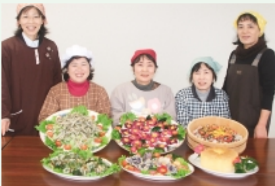
椿油を使用した料理（女性部）