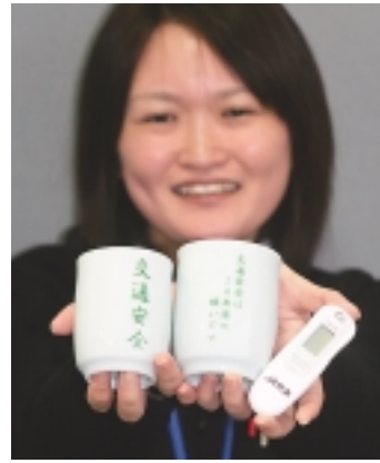
配布されたアルコールセンサーと交通安全標語入り夫婦湯呑

共済部では交通事故対策の取り組みとして、アルコールセンサー及び交通安全標語入り夫婦湯呑約一〇〇〇〇個を組合員に配布しています。 J Aでは、組合員の交通事故防止・飲酒運転根絶に対する意識を高め、これらの課題の解消に寄与することを目的に今回の活動を実施しています。 この活動の実施にあたりJ A共済部職員は、この活動を通じて、組合員の交通事故に対する意識が高まり、交通事故がゼロになることを期待している」と話しました。