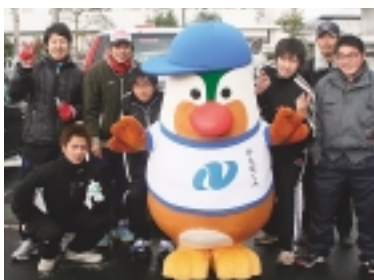
出場したJAごとう農産園芸部

一月三十日に五島 市体協主催で開催さ れた五島市民駅伝大 会に、JAごとうか ら経済部・農産園芸 部の二チームが出場 しました。 経済部は「JAご とう」の名前が入っ たユニフォーム、農産園芸部は今年四月に オープン予定の「産直市場 五島がうまい」 のロゴマークを描いたオリジナルのゼッケン をつけての出場と なりました。