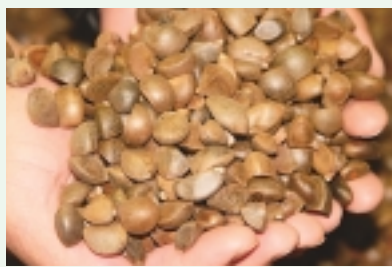
集荷された椿の実

今年度は約10トンの実の集荷を行い、製油量は約3,000リットルになる見込みです。