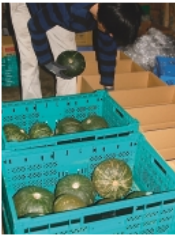
抑制力ポチャの箱詰め作業

J A管内の平成二十二年度産抑制力ポチャは、作付面積約十畝で約九十トンの出荷を計画しており、サイズは3Lから2Lが中心。 J A担当者は「夏の猛暑などの影響を受け、着果が心配されたが、八月下旬に気温が下がり、台風の影響もなく順調に着果した。貯蔵期間中に熟成が進み、品質も良いものができている」と話しました。