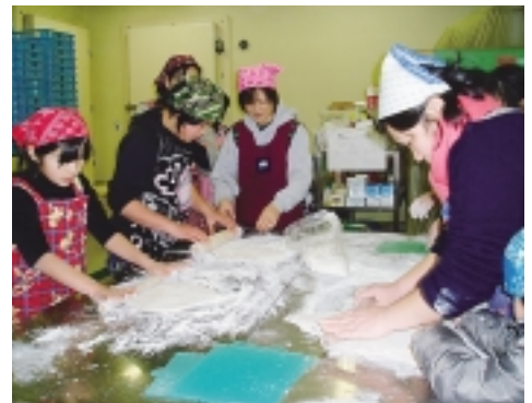
上手にできるかな?