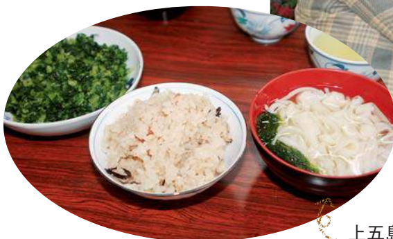
上五島加工部による真心あふれる昼食