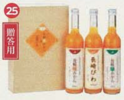
長崎恋みかん・長崎びわ させぼ温州(500ml)1、原口(500ml)1、 長崎びわドリンク(495ml)1セット ¥3,240

※ ●で囲まれた番号の商品は県内産の農産物を使用しています。 (◎は一部県内産農産物を使用しています。) ※ 季節商品 4月～10月の販売です。 ※ 表示価格はすべて消費税込みです。 ※ 掲載写真のサイズ比率は商品毎に異なります。 (内容量については上記の各数値をご覧ください。)