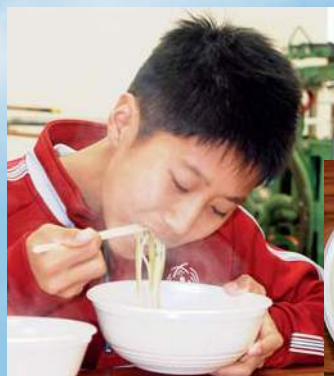
熱々のうどんに大満足☆