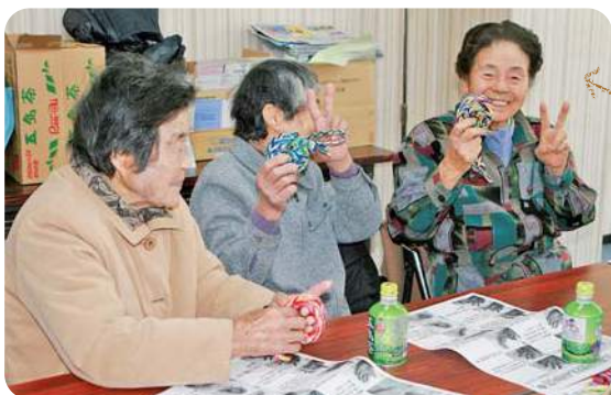
できあがった作品に大満足の参加者

当JA女性部は三月四日、上五島支店で初めてとなる上五島地区交流会を開きました。会には上五島地区の女性部員二〇名を含む三〇名が参加。アクリル毛糸を使った洗剤いらずのエコたわし作りや、米袋を活用したエコバック作りを行いました。