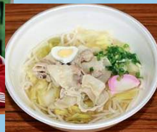
五島豚を使った五豚うどん