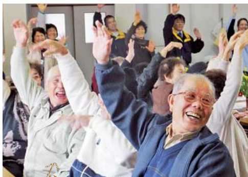
笑いの絶えない頭の体操

当JA女性部助け合い組織はまゆ部会は二月二十六日、五島市玉之浦町の中須生活館で玉之浦地区ミニデイサービスを開きました。今回は玉之浦地区の年金友の会会員と部会員など合わせて四〇名が参加。同部会では年に数回管内各地区でミニデイサービスを実施しており、さまざまなレクリエーションで年金友の会会員を中心に地域のお年寄りを楽しませています。