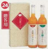
長崎恋みかん させぼ温州(500ml)1、 原口(500ml)1セット ¥2,160