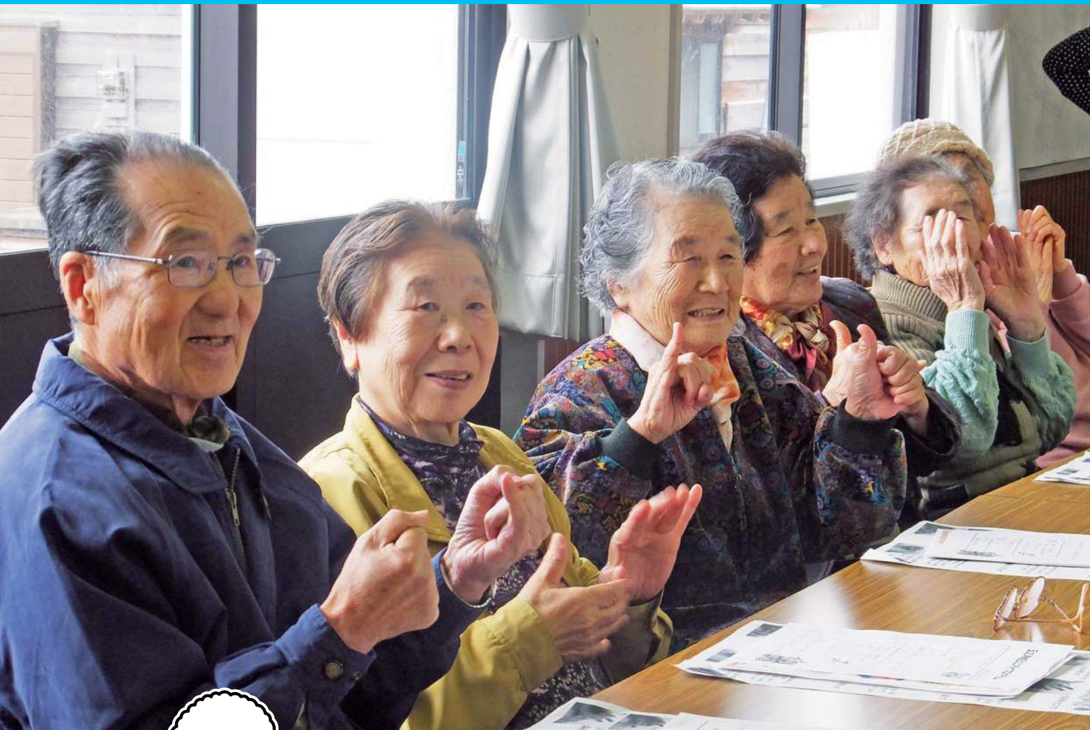
4 ページ 玉之浦地区ミニデイサービスの様子