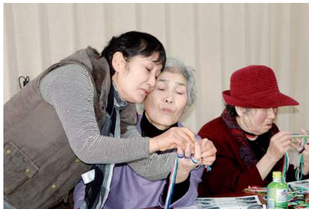
たわしづくりを指導する下地区役員

会の終盤では、上五島加工部のメンバーが名物の五島うどんのふしを使った料理などで昼食を振る舞い、終始和やかなムードでした。