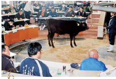
多くの購買者で賑わう市場 (五島市吉久木町)