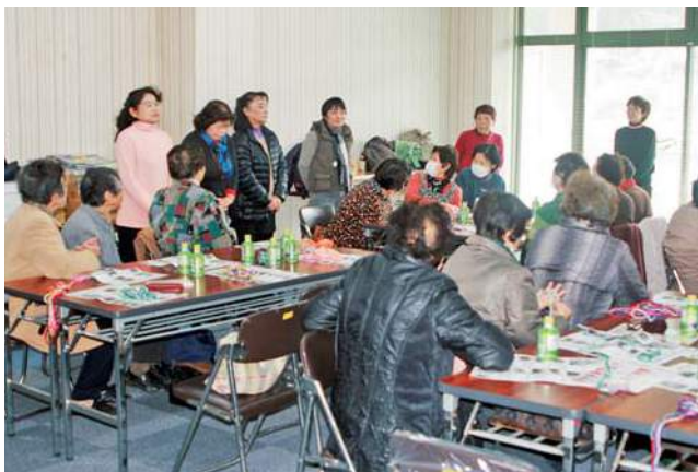
女性部役員によるあいさつ