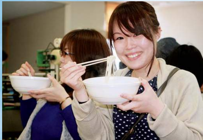
各製麺所自慢の逸品を提供