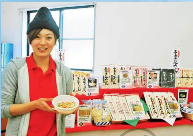
試食会と併せて五島うどんの販売も行われました

特産の五島うどんを盛り上げようと、今年で第四回となる「五島うどんば食うてさるこ」が三月二十二日、新上五島町で開かれ、多くの参加者が開始時間前から各製麺所に行列を作りました。このイベントは、日本三大うどんの一つといわれる五島うどんをもっと身近に感じてもらうと長崎県五島手延うどん振興協議会が四年前に企画したもの。