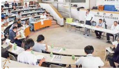
今年度も引き続き増頭へ取り組む

平成二十七年三月末の繁殖雌牛は前年より八二頭増えて四二二二頭。目標とする五〇〇〇頭の達成に向けた挑戦が続いています。