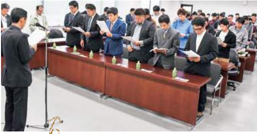
JA 青年組織綱領唱和

今年度の盟友数は六十四名（前年七十名）。活動の重点事項を、次世代のリーダー育成、青年部盟友の所得向上、広報活動の強化、と定め展開していきます。