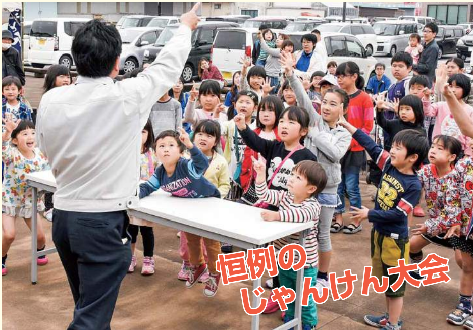
恒例の じゃんけん大会