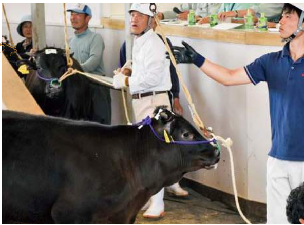
高値に驚きの表情

当JAは五月十三日、十四日の両日、五島家畜市場で平成二十八年五月期せり市を開催しました。子牛の平均取引価格は八万九〇四六円（前回は二・八％高）と過去最高、上がり続ける価格に場内では「高いな」と驚きと喜びの声が聞かれました。一九二戸の畜産農家が子牛五〇三頭（前回五一二頭）、成牛六二頭、計五六五頭の黒毛和種を上場。子牛の最高価格は一八万三六八〇円、成牛六二頭の平均取引価格は五二万九四九円（前回は四・六％高）でした。