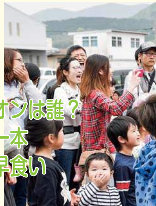
チャンピオンは誰？ まるまる一本 キュウリ早食い