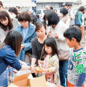
ビンゴ大会で景品ゲット