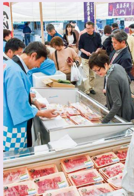
皆様が丹精込めて育てた 農畜産物は大好評です！