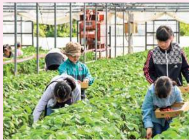
どれにしようかな…

好評につき開催しました 当JAフレッシュミズ部会は五月一日、(株)五島農園のハウスでイチゴ狩りを行いました。昨年、実施して好評だったイチゴ狩り。部員の強い要望で今年も実現しました。 参加者はおよそ四十名、その多くが親子で参加。ある参加者は「子どもがいるだけで楽しい」と元氣いっぱい子どもたちを見て微笑んでいました。親子参加型の活動が多いフレッシュミズ部会、活動に興味のある方はお気軽に最寄りの支店・出張所にお尋ねください。