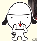
コメを持ち上げ力自慢。 おろしたら負けのサバイバル。