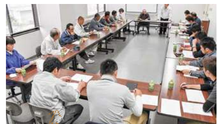
出荷規格を確認 間もなくピークを迎えます

当JAきゅうり部会は五月十六日、JA本店にて平成二十七年産出荷実績の報告や平成二十八年産出荷計画・出荷規格を協議する役員会を開催しました。今年産の定植時期は雨が多く、作付けの遅れが心配されましたが、順調に生育しています。