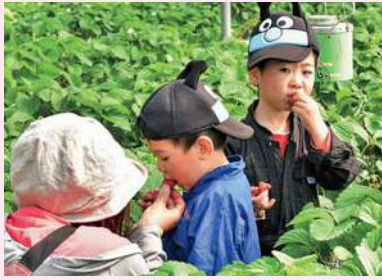
あの人気者もイチゴ狩り？