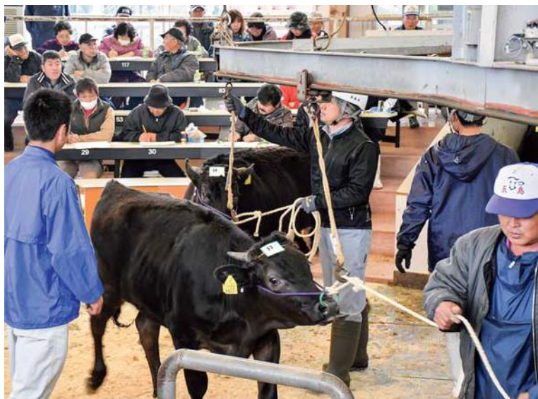
初日はばらつき下げるも、2日目は持ち直した市場

JA畜産部担当者は「前回より三万円程度（の下げ）は覚悟していた」と話していました。結果としては、初日は子牛のばらつきがひどく前回平均より六万三〇一〇円の下げ。二日目は雌二七〇キロ、去勢二八六キロの平均体重とかなり粒ぞろいが良く、持ち直しました。 JA畜産部担当者は「適性出荷体重の重要性がわかる結果となった。冬場の防寒対策、増飼い等の指導を徹底していく」と来期の改善を誓っています。