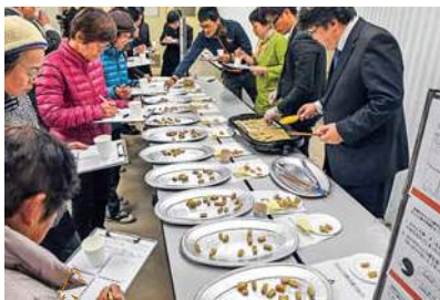
地域のかんころ餅の 食べ比べをする参加者

長崎県は三月十八日、かんころ産業（サツマイモを茹で干した『かんころ』を使用した食品に係る産業）の今後の戦略を支援するため、五島地域内外の事業者と住民を対象としたワークショップを開催しました。『かんころを五感で感じる』をテーマに五感のトレーニングや地域のかんころ餅の食べ比べを行いました。ワークショップは五回目。かんころの歴史的価値、加工技術など、毎回テーマを変え実施してきました。今回初めて、長崎市、五島市、新上五島町それぞれに会場を置き、三会場を双方向の遠隔会議システムでつなぎ、地域を超えての開催となりました。ワークショップ後に開催したかんころ産業関係者会議（昨年に続き二度目の開催）では、地元高校生や事業者が平成二十八年度のかんころ関係の取り組みを発表。活発な意見交換会も行いました。