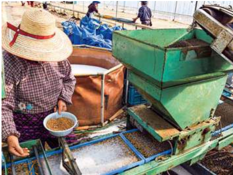
育苗箱に種子をまく様子

徹底し、良い苗を農家に提供したい。今年もおいしい米が育つよう話を引き締めて管理にあたる」と話されています。育苗施設で約一ヶ月育てられた苗は四月中旬から順次、農家へ配布され、八月中旬頃に収穫を迎えます。