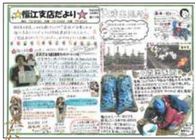
平成29年2月発行 『福江支店だより』