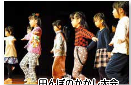
田んぼのかかし大会