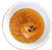
和風オニオン グラタンスープ