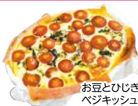
お豆とひじきの ベジキッシュ

各担当で作る料理を分け、協力し合いながら調理し、完成後、美味しい出来上がりに笑顔を増かべていました。