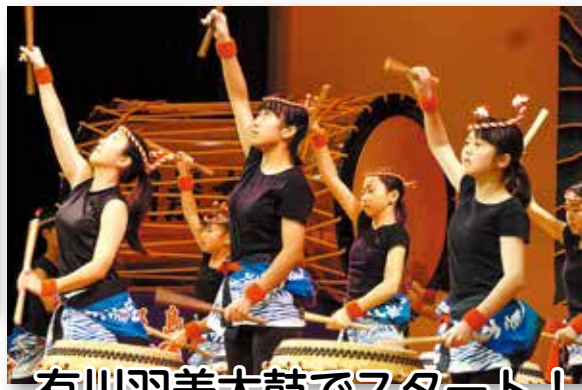
有川羽差太鼓でスタート！