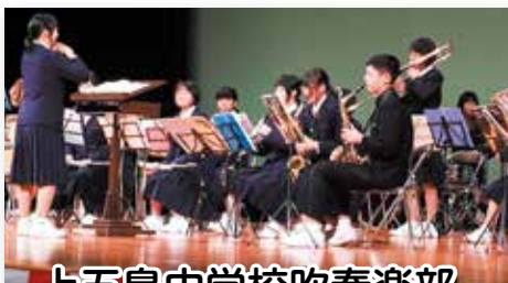
上五島中学校吹奏楽部