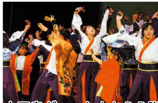
上五島ざあーなよかPR隊