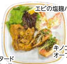
エビの塩麹パン粉焼き