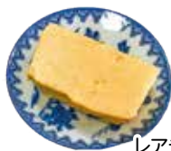
カボチャと ヨーグルトの レアチーズケーキ