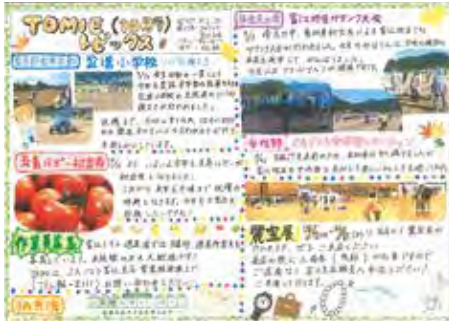
令和元年度10月発行の富江支店だより