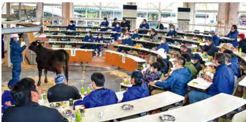
令和2年3月期せり市成績表（子牛）

三月十三日、十四日の両日、五島家畜市場で令和二年三月期せり市を開き、成績は下記の表の通りです。市場には家畜農家一九二戸が子牛五五〇頭、成牛四五頭を上場（売却五九二頭、本人三頭）。子牛の最高価格は一一〇万二二〇〇円、成牛の最高価格は一一一万八七〇〇円となりました。 畜産担当者は「今回のせり市は、新型コロナウイルスの影響で前回より雌で八万五千円、去勢で一〇万円、トータルで九万七千円下げとなりました。今後も推移すると思われるので子牛飼養管理により一層努めてください」と話しました。