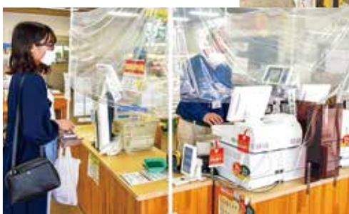
『産直市場五島がうまい』レジ