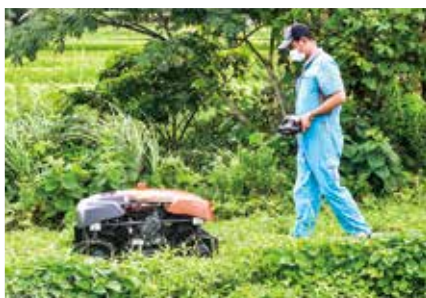
ラジコン草刈り機