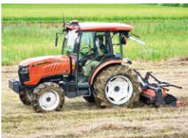
直進キープロクター

近年は担い手の高齢化や労力不足により、本地域の水稲生産者が減少しています。今後、水稲作業の省力化、作業を担うオペレーターの負担減少と新たな人材の育成が急務であるため、先端農業を組み込んだスマート農業の展開が必要となっています。