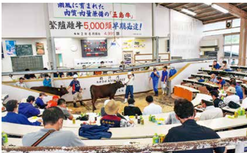
令和2年7月期せり市成績表（子牛）

畜産担当者は「初日の子牛価格が安く心配されたが、二日目の価格は良くなり、前回よりも平均価格を一・六パーセント上げることができた。」と話しました。