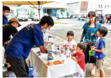
青年部によるかき氷販売