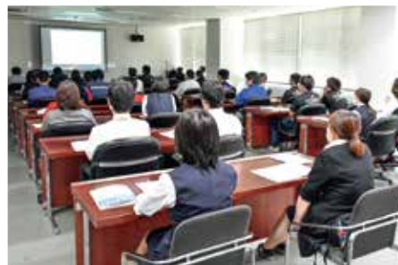
コンプライアンス研修