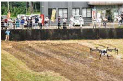
ドローンによる農薬散布

七月十七日。本店二階会議室で令和元年産ブロッコリー出荷反省会を開きました。令和元年度産の秋冬ブロッコリーは栽培戸数六〇戸で二八・六ㄲ（前年比一〇五パーセント）を栽培。は、栽培戸数三四戸で七・四ㄲ（前年比一四〇パーセント）を栽培。恵燐から定植が始まりスムーズに活着し生育は順調でした。暖冬の影響を受け、例年であれば四月上旬頃の出荷となる作型が三月二十五日より出荷開始され、五月連休明けにはピークを過ぎ、例年より十日ほど早く終了。出荷数量は二三六一四八玉（約七〇㌔）でした。 定植・収穫作業に苦勞する年となりましたが、今後も生産者にとって生産意欲につながる販売対策を話し合い、検討していきます。