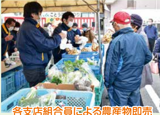
各支店組合員による農産物即売

十一月二十八・二十九日の両日、下地区の農業まつりを開催しました。毎年恒例の農業まつりは地域振興への貢献と地域住民のJA事業への理解醸成を目的としています。新型コロナウイルスの感染拡大防止のため規模を縮小しての開催となり、いつもとは雰囲気の違いが会場となりましたが、新鮮な農畜産物を求めて多くの方に来場いただき、楽しんでもらえる農業まつりとなりました。二日間で約三五〇〇人の地域の方々にご来場いただきました。