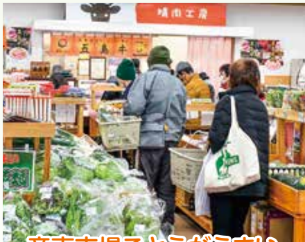
産直市場ごとうがうまい