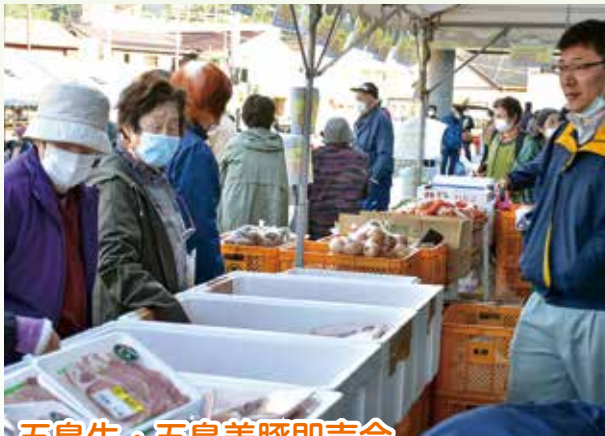
五島牛・五島美豚即売会