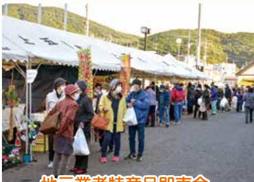
地元業者特産品即売会