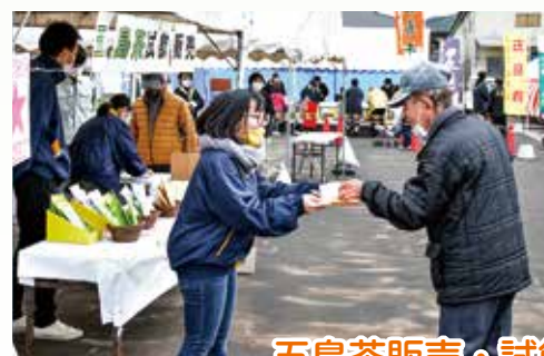
五島茶販売・試飲