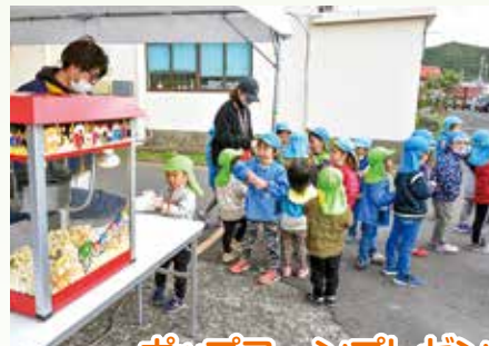
ポップコーンプレゼント