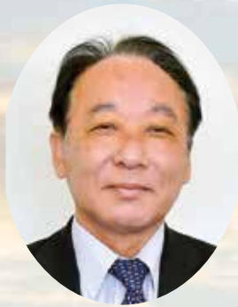
ごとう農業協同組合 代表理事組合長

結びに、皆様方のご健勝とご多幸をお祈りするとともに、農協経営に対しご指導ご協力をお願い申し上げます。新年のご挨拶とさせていただきます。