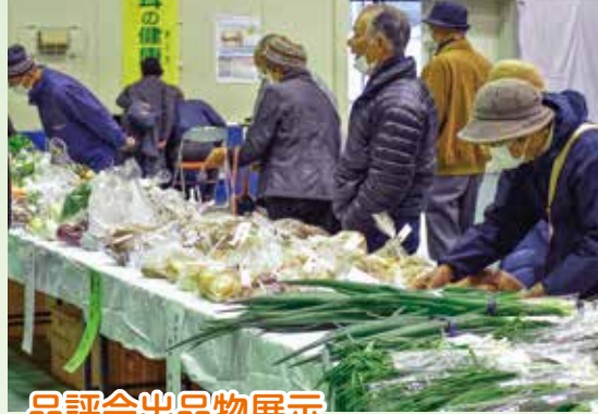
品評会出品物展示

十二月六日、新上五島町石油備蓄記念会館で上地区の農業まつりを開催しました。ステージイベントは自粛し、規模を縮小しての開催。会場内には農産物品評会の出品物が並び、外では新鮮な農畜産物を販売しました。地域住民へ五島農業のすばらしさをPRするこのできた農業まつりとなりました。